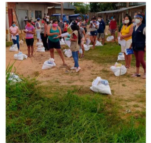
Cáritas del Perú Equipo Técnico de Respuesta a Emergencias de Cáritas del Perú

La Red Cáritas en el Perú está conformada por 49 Cáritas Locales distribuidas a nivel Nacional. Los equipos de respuesta de las Cáritas Locales, voluntarios, miembros de la iglesia (catequistas, párrocos, diáconos, laicos, congregaciones religiosas entre otros) desplegaron la logística y recursos para llegar a las poblaciones vulnerables a nivel nacional.