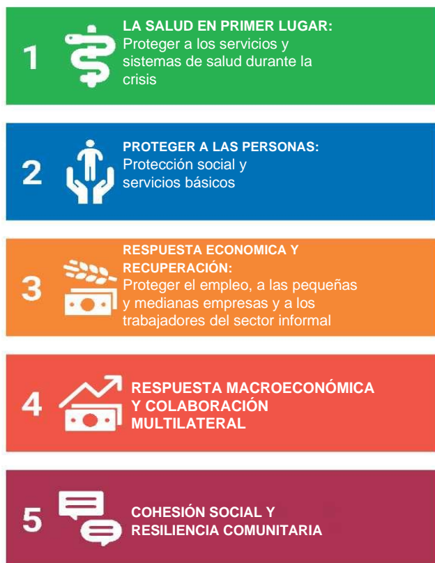
GRÁFICO 1: CINCO PILARES DE LA RESPUESTA DEL SISTEMA DE LAS NACIONES UNIDAS PARA EL DESARROLLO